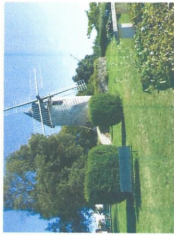
Moulin de Capet MONPEZAT D'AGENAIS

2019 Journées européennes 18 et 19 mai Journées nationales 22 et 23 Juin Journées du patrimoine