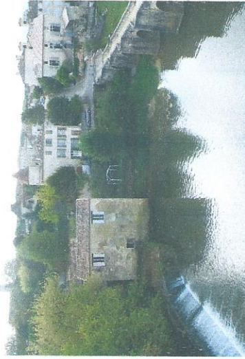
Moulin Batan BARBASTE

2019 Journées européennes 18 et 19 mai Journées nationales 22 et 23 Juin Journées du patrimoine